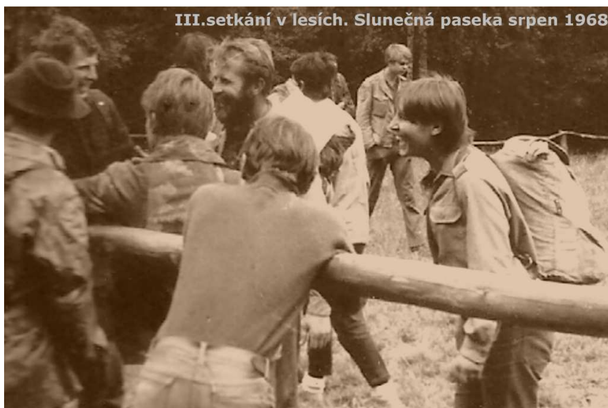
III.setkání v lesích. Slunečná paseka srpen 1968

Článek z dobového tisku o III. Celostátním setkání v lesích.