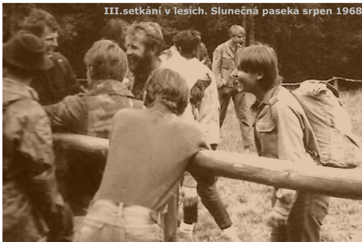
III.setkání v lesích. Slunečná paseka srpen 1968

Článek z dobového tisku o III. Celostátním setkání v lesích.