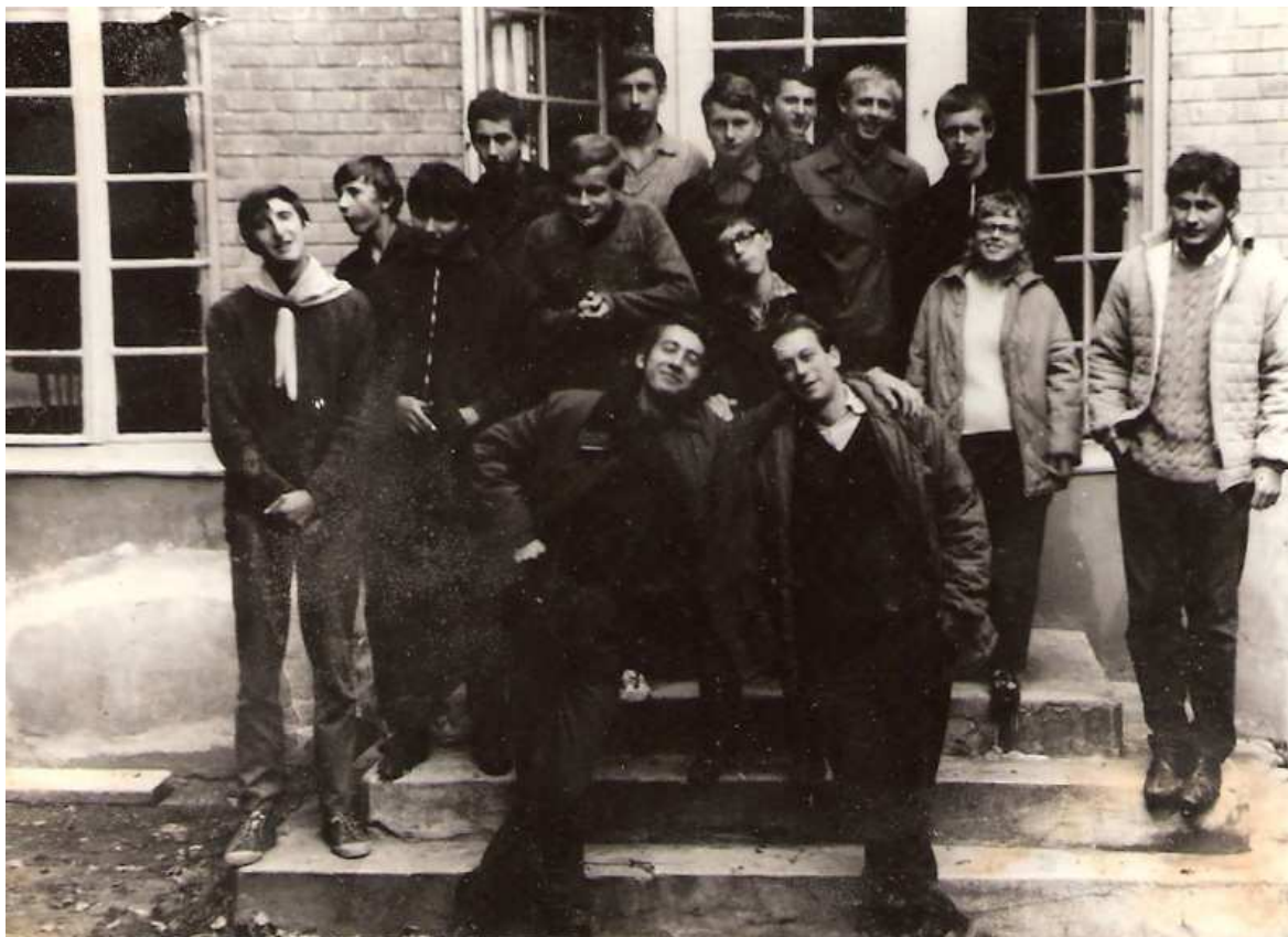
Účastníci semináře k tábornictví pod Břestecskou skalou 1968

4. Základní spojovací nití všech táborníků jsou podle nás tábornické srazy. Navrhujeme tyto srazy organizovat především oblastně, v centru několika klubů a osad a u výhodných komunikačních spojů. ..