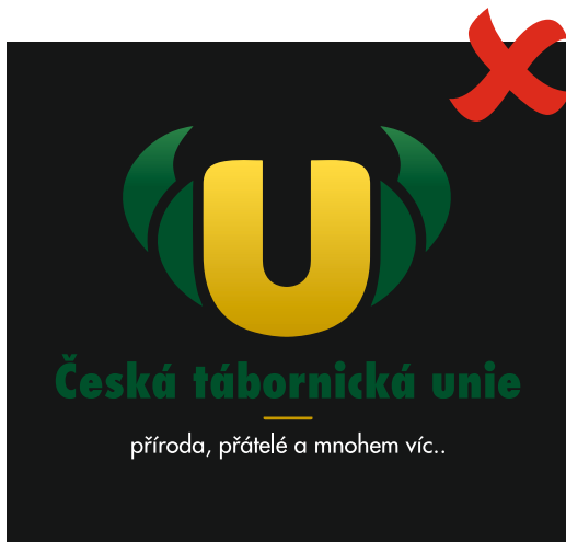
Barevné logo na barevném podkladu