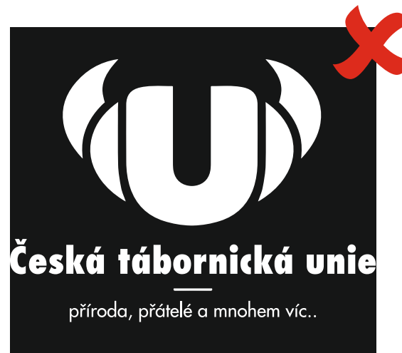
Logo bez ochranných zón