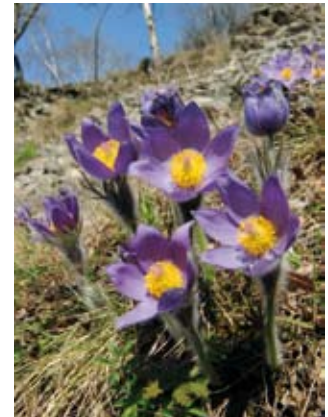
Koniklec otevřený, České středohoří