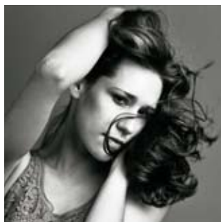
Nikola Márová primabalerína Národního divadla

V klasickém baletu se neustále posouvají limity a nároky na výkonnost, ale naštěstí se stále udržuje a ctí jeho dlouholetá tradice. V současnosti musí být ale tanečník ve velkém divadle všestranný a zvládat i nejnovější principy moderního a neoklasického tance.