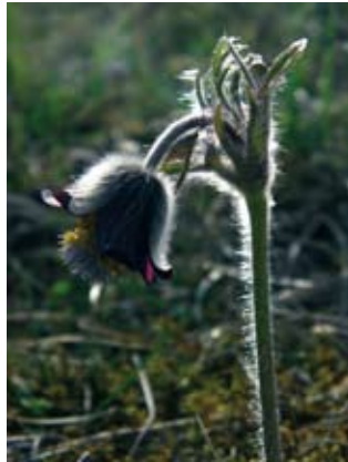
Koniklec alpský (vlevo), a koniklec český, Český kras (vpravo)

V České republice roste planě pět druhů konikleců. Všechny patří mezi vzácné a chráněné druhy naší přírody. Relativně nejběžnější jsou koniklec velkokvětý a koniklec luční, které lze stále ještě nalézt na stovkách lokalit; koniklec velkokvětý přirozeně výhradně na jižní a střední Moravě, koniklec luční v menší míře též na Moravě, především však ve středních a severozápadních Čechách. Koniklec otevřený má u nás již jen posledních zhruba dvacet lokalit, především v Podkrusnohoří, Českém středohoří a Podbezdězí. Ještě mnohem hůře je na tom koniklec jarní, který přežívá v Čechách na posledních pár lokalitách, na Moravě je pravděpodobně vyhynulý. Raritou je vysokohorský koniklec alpský, vyskytující se u nás výhradně v Krkonoších. Je také jediným našim bíle kvetoucím koniklecem, všechny