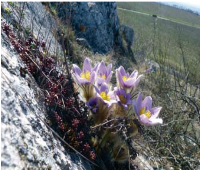
Koniklec velkokvětý, Pálava

ostatní druhy kvetou v různých odstínech fialové. Koniklece potřebují ke svému životu sušší osluněná místa s nepříliš zapojeným porostem jiných rostlin. Najdeme je tedy nejčastěji na různých suchých stráních, skalách, světelných lesích (často borových), na horských loukách. Proč jsou koniklece vzácné? V minulosti zanikaly kvůli zástavbě, zalesňování či jinému nevhodnému využití celé lokality. To už dnes doufejme vzhledem k zákonné ochraně všech druhů konikleců nehrozí, koniklece však nadále ubývají kvůli změnám prostředí. Jak již bylo řečeno, potřebují světlo a volný prostor. Často jde o bývalé pastviny, kde zvířata udržovala nízký porost a kopýtky narušovala drn. Jinde se alespoň pravidelně sekala tráva. Krom toho, že tohle po staletí tradiční využívání ve druhé polovině minulého století ustalo, přidal se i další problém. V důsledku různých lidských aktivit je dnes v přírodě ohromné množství živin (zejména dusíku), které způsobuje, že vše zarůstá mnohem rychleji než kdy dřív; často zarůstají křovinami i skály, které byly vždy přirozeně holé. Už tak oslabené populace konikleců následně decimuje přemnožená zvěř, především srnčí, které koniklece abnormálně chutnají.